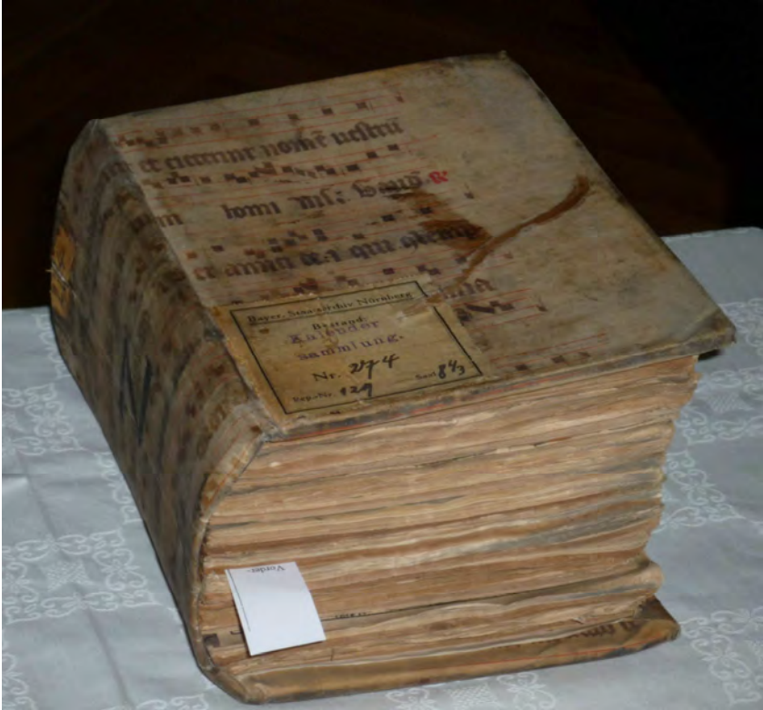
Bild 2. Eine Kalendersammlung mit dem Prognosticon Astrologicum auf das Jahr 1612 von Simon Marius aus dem Staatsarchiv Nürnberg

Auch bei den Sonnenflecken sieht sich Galilei im Vorteil und lässt im Dialogo Salviati feststellen: „Der erste Entdecker und Beobachter der Sonnenflecken, wie aller übrigen neuen Himmelserscheinungen, war unser Freund von der Akademie dei Lincei. Er entdeckte dieselben im Jahre 1610 [...]“. 14 Im Jahr 1632 datiert er seine ersten Beobachtungen auf Juli oder August 1610 in Padua und Florenz. Zumindest von Februar bis April 1612 sind seine Aufzeichnungen dunkler Flecken auf der Sonne überliefert und im August 1612 erwähnt er sie kurz im Vorwort seiner Abhandlung über die Bewegungslehre schwimmender Körper Discurso intorno alle cose, che stanno in sù l'acqua . Eine genauere Untersuchung