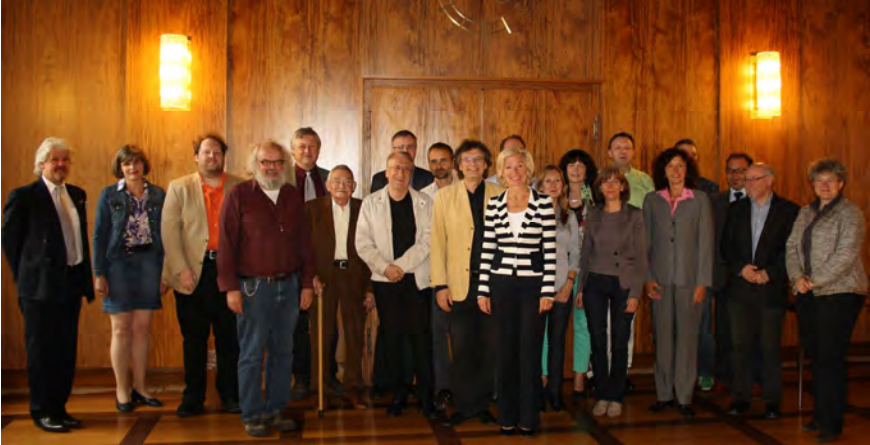
Bild 8 a–c. Treffen der Kooperationspartner des Simon-Marius-Jubiläums 2014 in Ansbach, Gunzenhausen und Nürnberg.

Nach der Recherche der Eigentümer der erhaltenen Marius-Schriften sowie der Erfassung eines Großteils der Sekundärliteratur erfolgte im Sommer die Kontaktaufnahme mit den deutschsprachigen Archiven, Bibliotheken und Verlagen. Meist waren die Einrichtungen sehr entgegenkommend, wobei aufgrund der Vielzahl das Staatsarchiv Nürnberg, die Stadtbibliothek Nürnberg und die Bayerische Staatsbibliothek hervorgehoben werden müssen. 77 Es wurden mehrere Kalender digitalisiert, die weltweit nur mit einem einzigen Exemplar bekannt sind. Im Zuge der Arbeit haben wir Kenntnis von weiteren Exemplaren des Mundus Iovialis erlangt, der nach aktuellem Stand mit über 30 Ausgaben erhalten blieb.