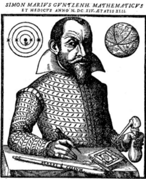
Simon Marius 1573-1625